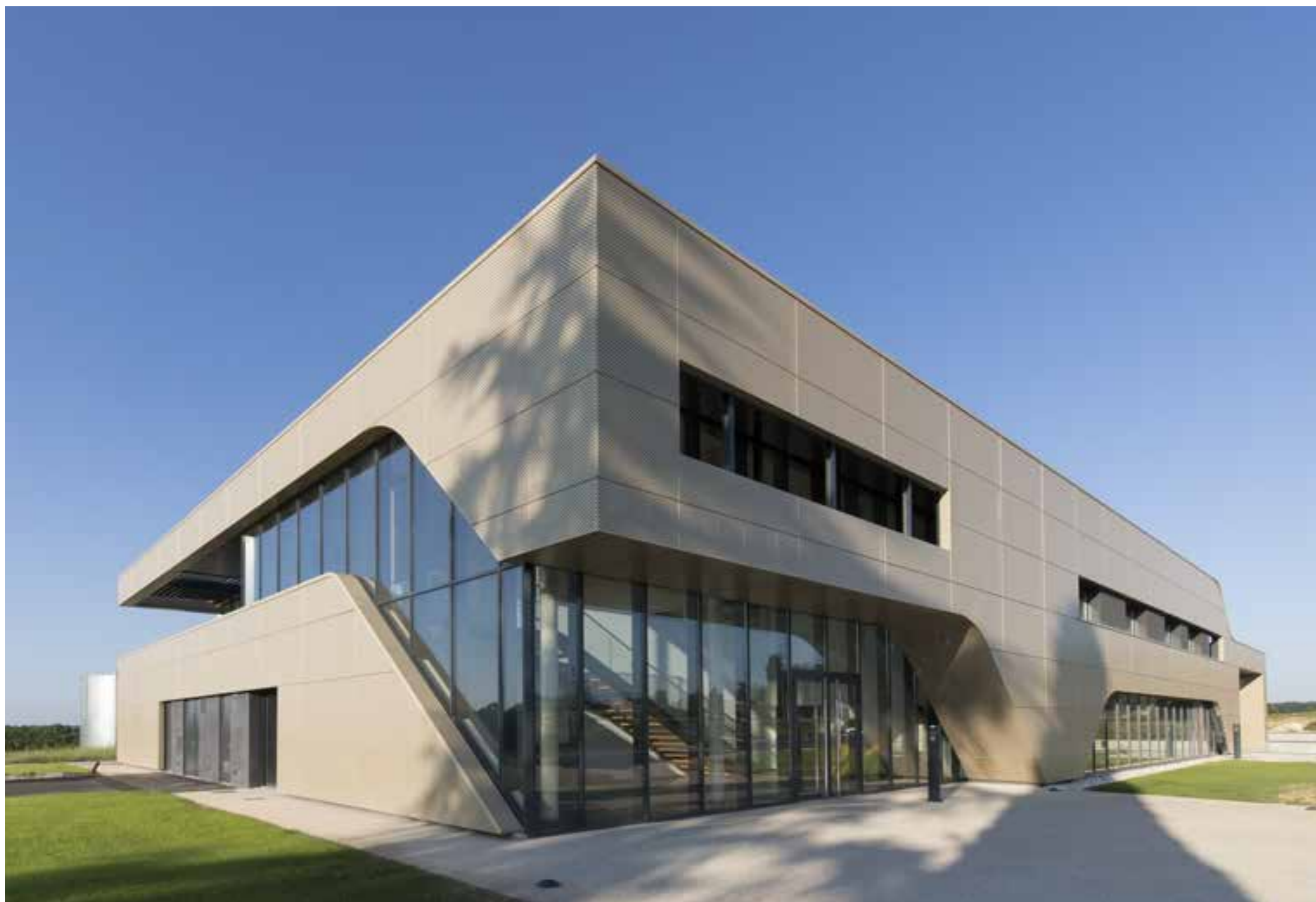
ALMA F.R.C, Magnac-Lavalette, Charente, France

ALMA F.R.C. LEADER MONDIAL DANS L'ENTRETIEN PREMIUM DU CUIR ET DES ACCESSOIRES POUR CHAUSSURES.