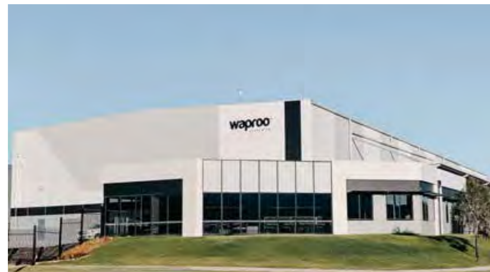
Dandenong South, Australie